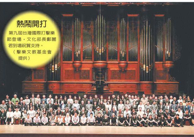
這兩天聽見大師們竭盡全力的演出，心情跟壓力反而變大，更加努力練習，希望不要讓大師們笑話。也有上上試音就令現場工作人員情緒沸騰，有一位來自法國的參賽者，身材嬌小，但是演奏能量和技巧非常出色，讓人眼睛一亮；還有一對來自日本的雙胞胎姊妹參賽者，兩人演奏風格

趙靜瑜／台北報導 誰敢賣一場不知道是誰演出的音樂會？只有擊樂家朱宗慶！ 由擊樂文教基金會主辦的第九屆台灣國際打擊樂節日前登場，首屆台灣國際打擊樂節大賽也將從今天起舉行。由於不知道誰會得獎，得獎者音樂會票房仍待努力，不過仍有500張票已經售出，主辦單位擊樂文教基金會執行長劉怡汝說，「這批死忠樂迷真的讓我們很感動，也希望大家都能為下一代打擊樂新星進場喝采。」 昨天首屆打擊樂節大賽正式舉行報到作業，參賽者也開始進入主要比賽場地--台北藝術大學音樂廳進行樂器試音。這次參賽者來自世界各地，包括台灣、中國、日、韓、美與法國等，個人組共42名，4重奏則有8組，年紀最小的才14歲，各個有備而來。 現場每個人試音的方法都不太相同，除了調整木琴的高度、換鞋，從段落試音到整首順走都有；選手們從聽場地的音色到挑選琴槌棒子，甚至有人還拿錄音機在台下試音，確保比賽當天自己演奏的音響，能到達最佳狀態。 評審之一的朱宗慶打擊樂團資深團員黃瑩瑩表示，不少參賽者