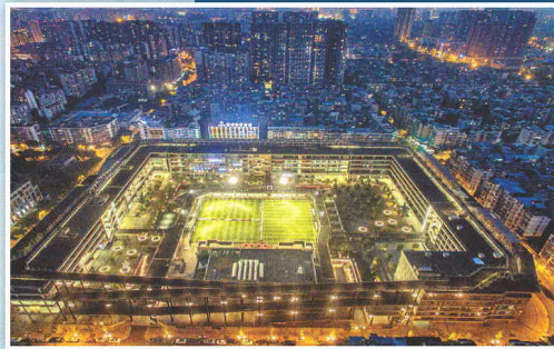
↑劉家琨於成都設計的《西村大院》榮獲2017遠東建築獎傑出獎。