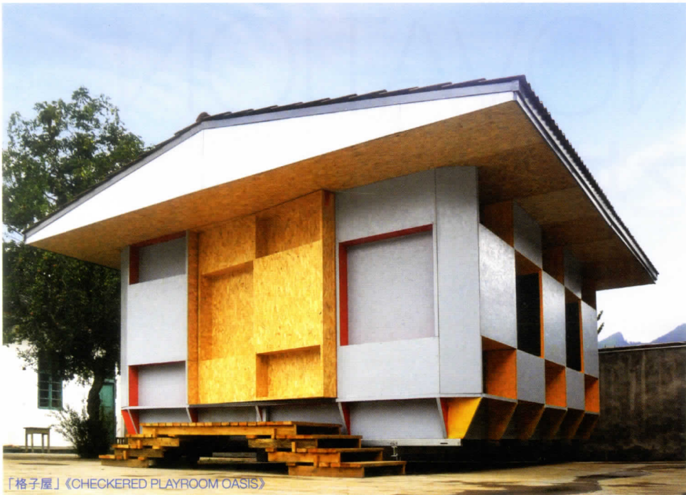
「格子屋」《CHECKERED PLAYROOM OASIS》

題，令它可以自行吸收太陽能、自行儲水等永續模式運行，這是新一代建築師想要追求的。」他指，政府有責任帶頭推動，使建築業可以向更創新、環保方向前進，零碳天地 (ZERO CARBON BUILDING) 就是一個很好的實驗展示，讓大家知道一座建築物用了多少能源，如何做到零排放。