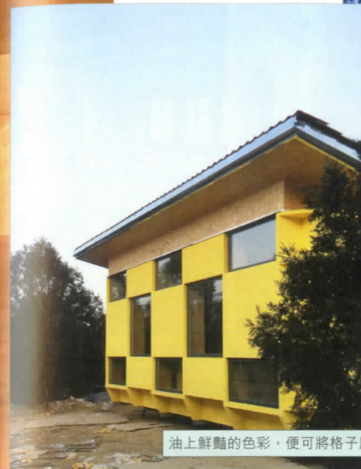
涂上鮮豔的色彩，便可將格子屋的形象扭轉。

近年看建築新聞，雖然沒有實質統計過，新建築在歐美及中國出現的比率確比數年前有著明顯的變化，中國一二線城市，幾乎每個月都有新建築插旗。時代巨輪是現實的，哪裡有資金，哪裡就有新項目，可是華麗的衣裳蓋在一個空氣嚴重污染、偷工減料的國度，也不過是國王的新衣而已。放眼全國，城鄉差異甚大，驅使中文大學建築系副教授朱競翔，帶領他的團隊，為被埋沒的窮困人口做點事情。