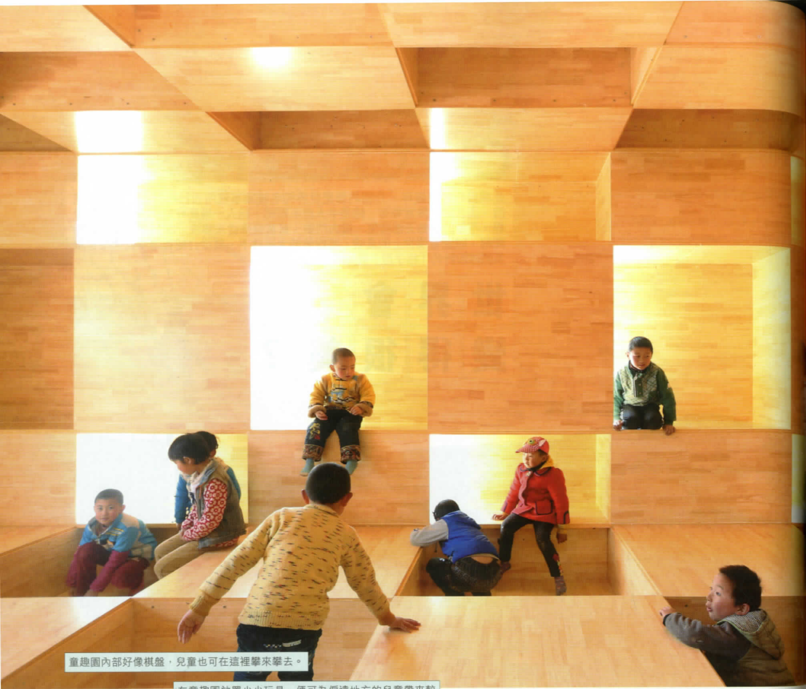
童趣園內部好像棋盤，兒童也可在這裡攀來攀去。