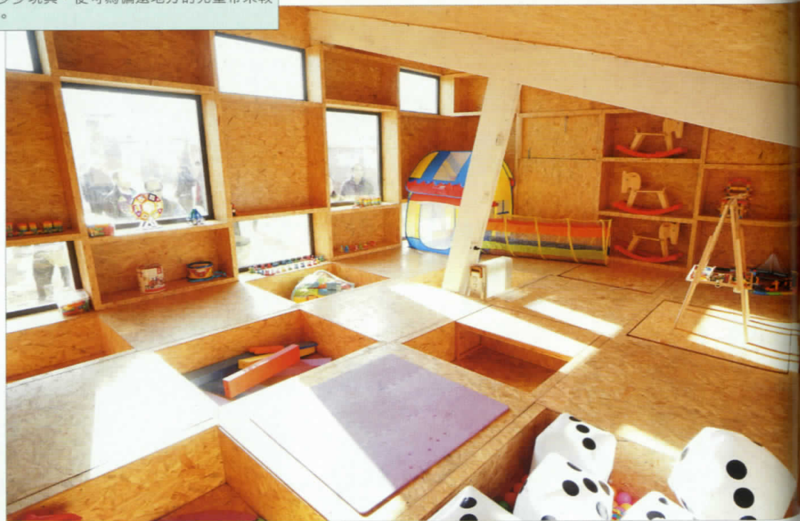
在童趣園放置少少玩具，便可為偏遠地方的兒童帶來較佳的玩樂環境。