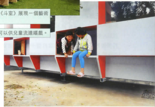
連外面的牆壁也可以供兒童流連嬉戲。