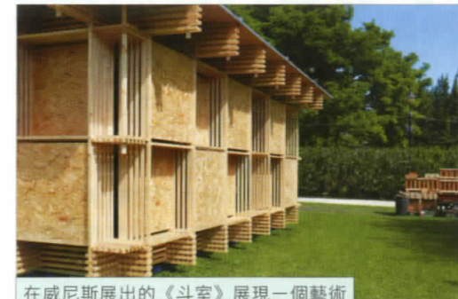
在威尼斯展出的《斗室》展現一個藝術版的格子屋。

能夠構思到如此美好的一個企劃，大概足以暫時解決眼前一些問題，當然，人類當下面對的問題太複雜，或許不是一間格子屋能夠解決，但如果每一個人都願意參與解決問題而非製造問題，我們的世界，才會向好的一方發展吧。■