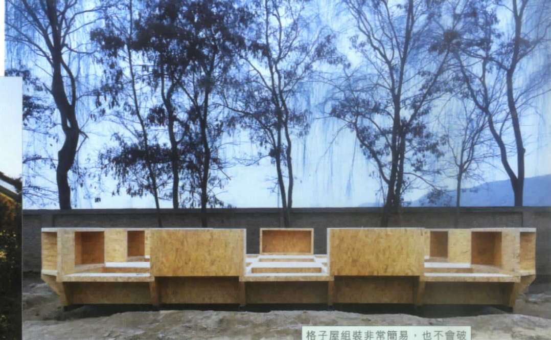
格子屋組裝非常簡易，也不會破壞環境。

「童趣園」之所以叫做格子屋，是因為它的基本組件都是一個個正方形的單位，建築師巧妙地設計之下，可以製成凹凸凸凸的平面，創造出無論視覺還是觸覺皆饒有趣味的空間，令人猶如置身棋盤之中，吸引兒童進入，而且牆壁上可以放置多種玩具，甚至可以讓成人在當中飲茶談天，為不同年紀的村民提供一個好好的社交場所。童趣園的建築元件特別採用有絕緣結構的物料製作，具備保溫效果，在中國的窮鄉僻壤，暖氣自然是奢侈品，能夠使用建築物料來保暖，足見建築師的細心。